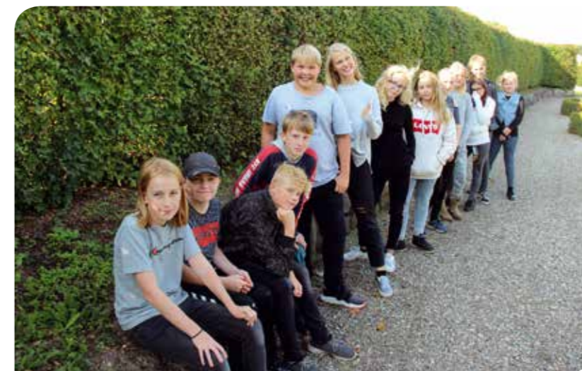
13 konfirmander er netop startet med undervisningen.