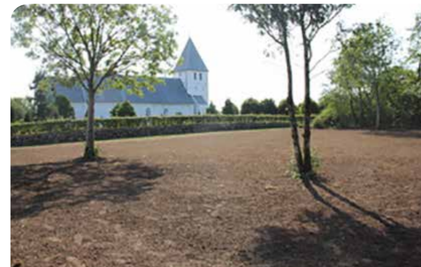
Så er der ryddet og sået græs i det ny-indkøbte stykke jord nordøst for kirken.

*BUSK Gudstjeneste: Familiegudstjeneste. Børn Unge Sogn Kirke.