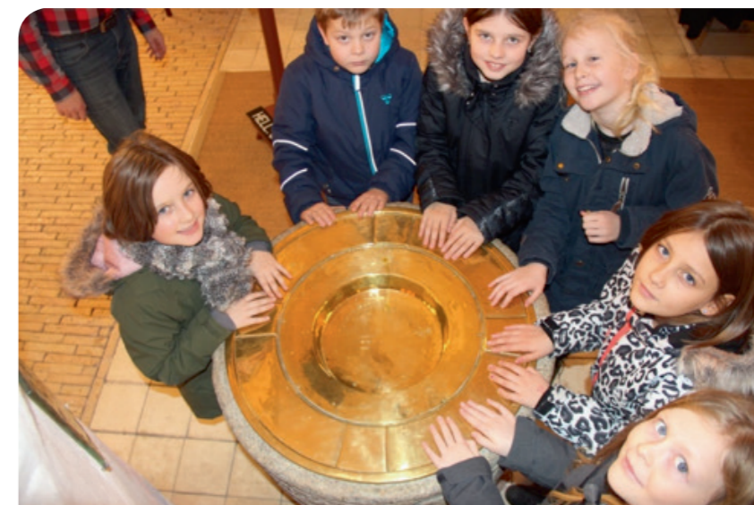
Indenfor lærer Minikonfirmanderne om dåben