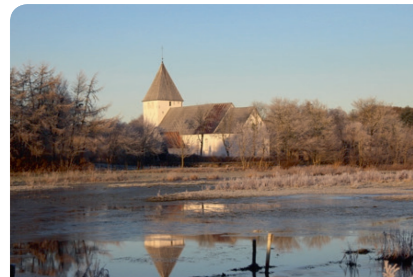
Udenfor bider frosten

Afleveres senest 5. januar (februar/marts) gerne pr. mail: bod@km.dk